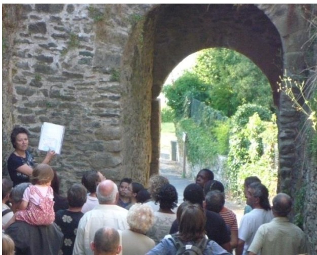
Les remparts et la poterne